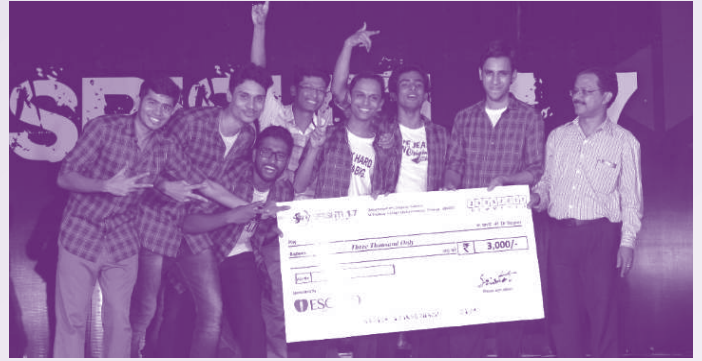
ജൂബിലി മിഷൻ മെഡിക്കൽ കോളേജ് ഡാൻസ് ടീം KRONOZ, സെന്റ് തോമസ് കോളജിൽ നടത്തിയ SRISHTI 2017 WALTZ ഡാൻസ് മത്സരത്തിൽ മൂന്നാം സ്ഥാനം നേടി.