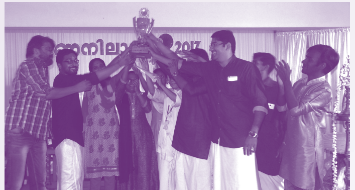
ഓണാഘോഷത്തോടനുബന്ധിച്ച് നടത്തിയ പൂക്കളെ മത്സരത്തിൽ ഒന്നാം സ്ഥാനം നേടിയ ഗോൾഡൻ ജൂബിലി & അഡ്മിൻ ബ്ലോക്ക് ടീം