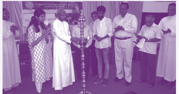
എം.ബി.ബി.എസ്. 15-ാം ബാച്ച് ഉദ്ഘാടനം തൃശൂർ അതിരൂപത മെത്രാപ്പോലീത്ത മാർ ആൻഡ്രൂസ് താഴത്ത് പിതാവ് നിർവ്വഹിക്കുന്നു.