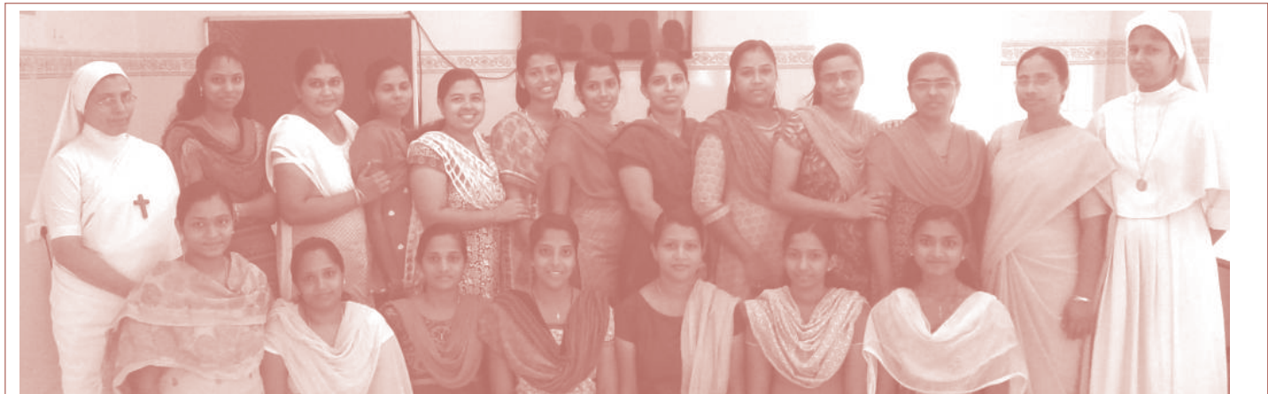
ജൂബിലി മിഷനിൽ ജൂലായ് 6 മുതൽ ജൂലായ് 11 വരെ നടന്ന നഴ്സസ് ഓറിയന്റേഷൻ പ്രോഗ്രാം - ബാച്ച് 010-15.

ജൂബിലി മിഷനിലെ രോഗികൾക്ക് തങ്ങളുടെ സാഹിത്യരചനകൾ ജൂബിലിയിൽ പ്രസിദ്ധീകരിക്കാൻ താൽപര്യമുണ്ടെങ്കിൽ വാർഡ് ഇൻ ചാർജുമാരെ അറിയിക്കുക.